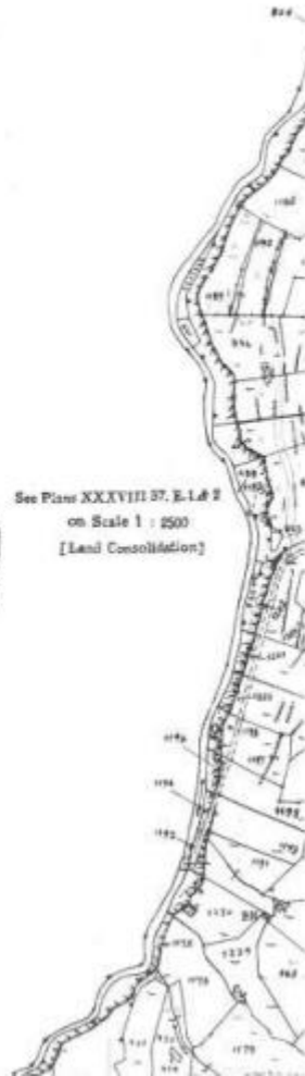
See Plan XXXVIII ST. E-1.6 2 on Scale 1 : 2500 [Land Consolidation]